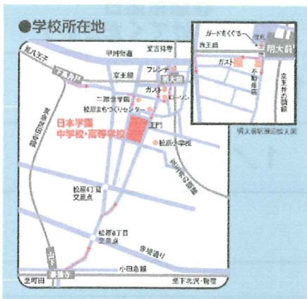
主要駅からの所要時間(登校時)